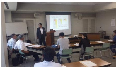
ワークショップ風景(イメージ)